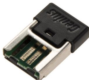
دانگل یا رسیور USB

در شکل زیر دانگل USB ماوس و کیبورد SlimStar-8005 را مشاهده میکنید.